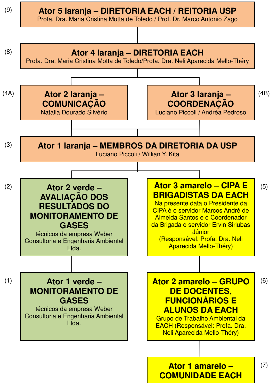
Figura 1: Organograma